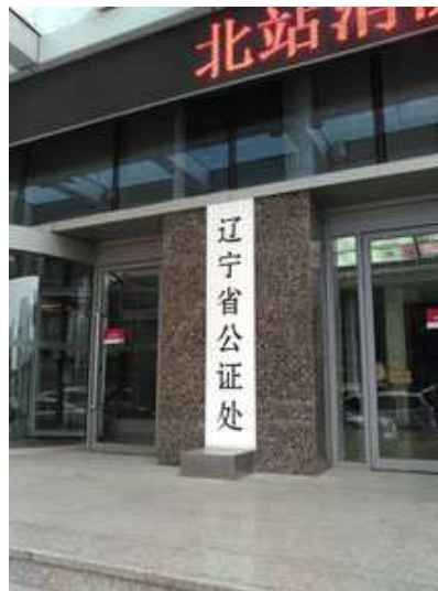
(中国・遼寧省公証処)